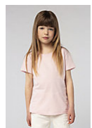
SOL'S CHERRY 11981